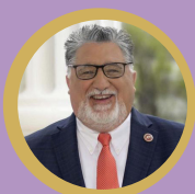
Senator Anthony Portantino